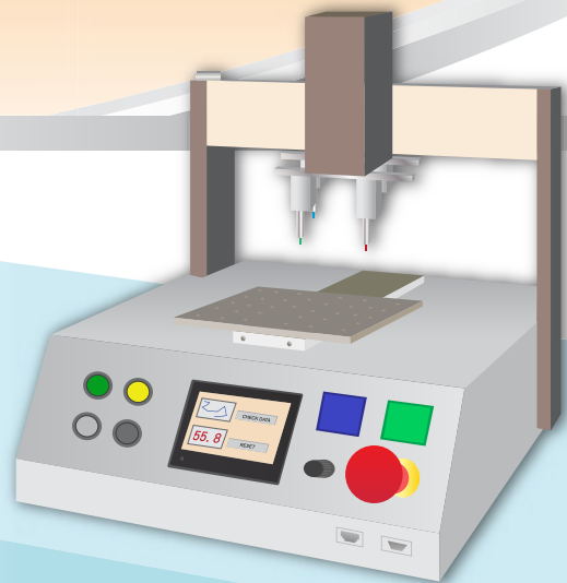
自動追蹤路徑和置入產品數據系統