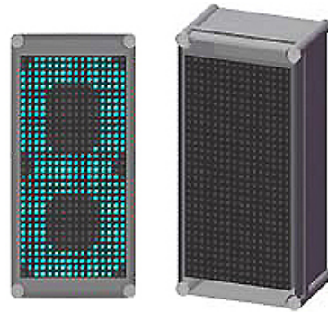
1 位數 防水型彩色矩陣顯示看板 (防水箱 * 1) 外型尺寸：190(w)x380(h)x130(d) mm